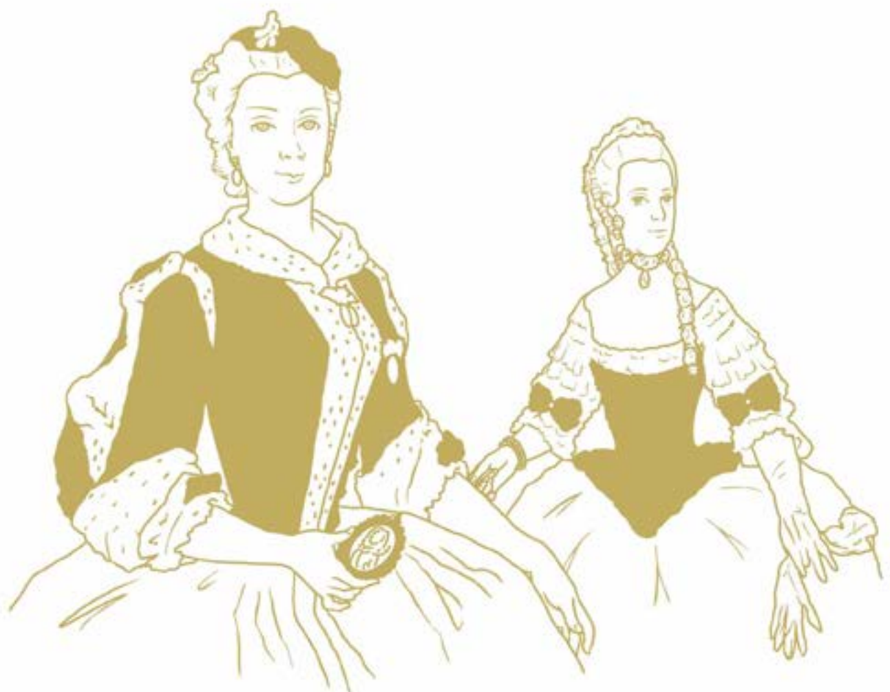
Maria Amalia di Sassonia